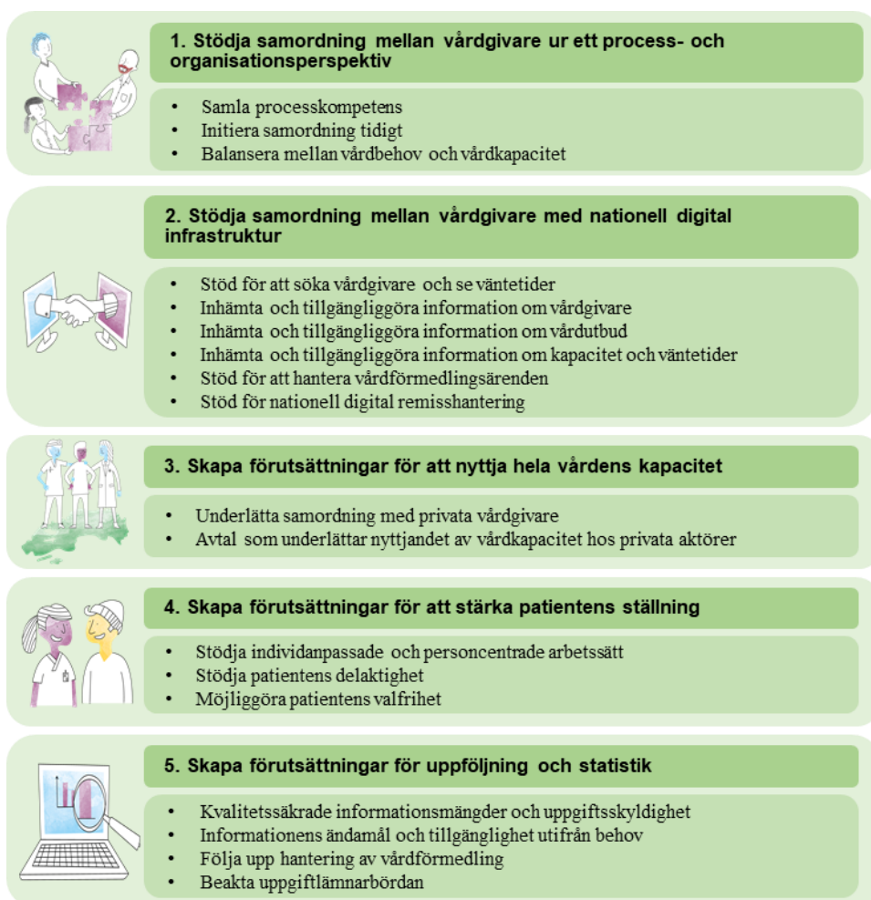
Figur 2. Fokusområden och lärdomar i det fortsatta arbetet med nationell plan för nationell vårdförmedling

Utifrån uppdragsdirektivet, erfarenheter från angränsande uppdrag och andra länder samt dialog med berörda aktörer, har arbetet delats in i fem preliminära fokusområden. Dessa utgör det som för närvarande ingår i nationell vårdförmedling. Indelningen utgör ett ändamålsenligt angreppssätt och underlättar för att samla närliggande frågeställningar, lärdomar och förslag på insatser i det fortsatta arbetet på ett överskådligt sätt. För varje fokusområde finns information om dess innehåll, koppling till angränsande uppdrag, vilka lärdomar som framkommit av den internationella utblicken och hur fortsatt arbete med planen för nationell vårdförmedling ska utföras för varje fokusområde. Fokusområdenas omfattning varierar eftersom arbetet kommit olika långt. En sammanställning av de fem fokusområdena och lärdomar så här långt i arbetet framgår av figur 2.