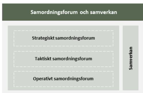
Figur 1 Samverkansstruktur inom Ena-Sveriges digitala infrastruktur

En samverkansorganisation har till syfte att samordna och prioritera gemensamt arbete inom domänen. I arbetet inom Ena genomförs samverkan i samordningsforum på strategisk, taktisk och operativ nivå, se figur 1.